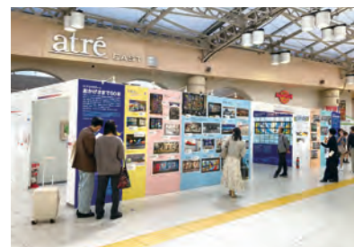
パブリックアート普及活動特別展