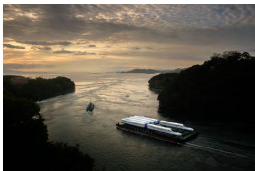
九州旅客鉄道株式会社社長賞 「飛躍」長崎 みなと