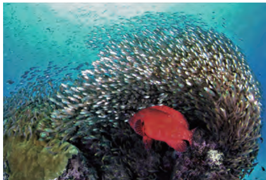
環境大臣賞 「躍動」谷口 常雄